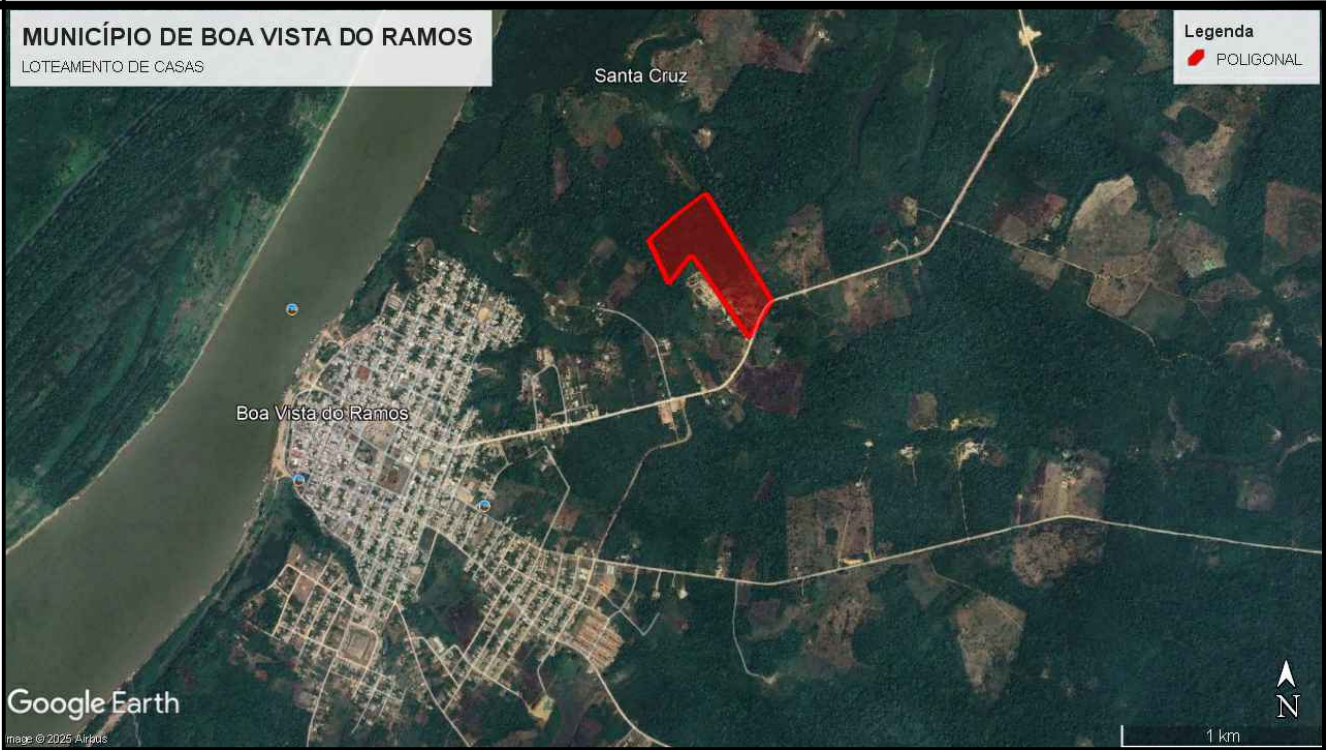
IMAGEM MACRO DE SATÉLITE - SITUAÇÃO SEM ESCALA